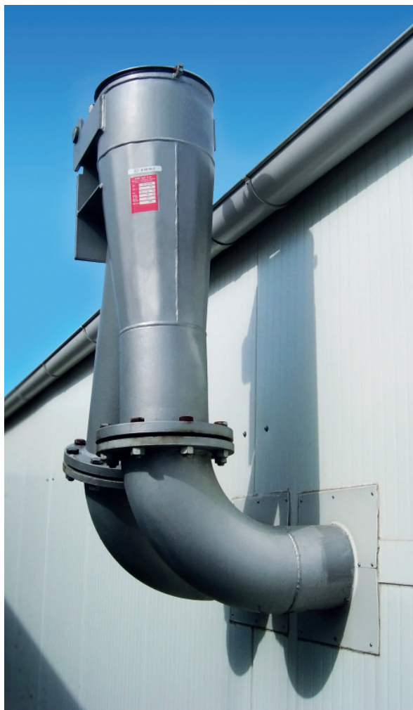
Схема установки взрывоотвода